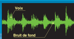
Réducteur de bruit inactif

Réduit le bruit de fond de près de 90% (20 dB) permettant d'améliorer à la fois votre modulation et l'audio entrante.